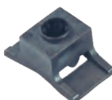
EM7 - EM7P